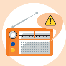
Radio & Television