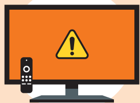
Digital information screens