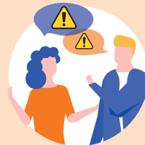
Familien- und Freundeskreis, Nachbarschaft