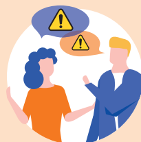
famille et amis, voisinage