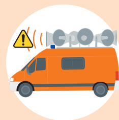
véhicules à haut-parleur

Ces informations ont vocation à atteindre le plus grand nombre de personnes possible. C'est pourquoi il existe différents moyens de les diffuser: